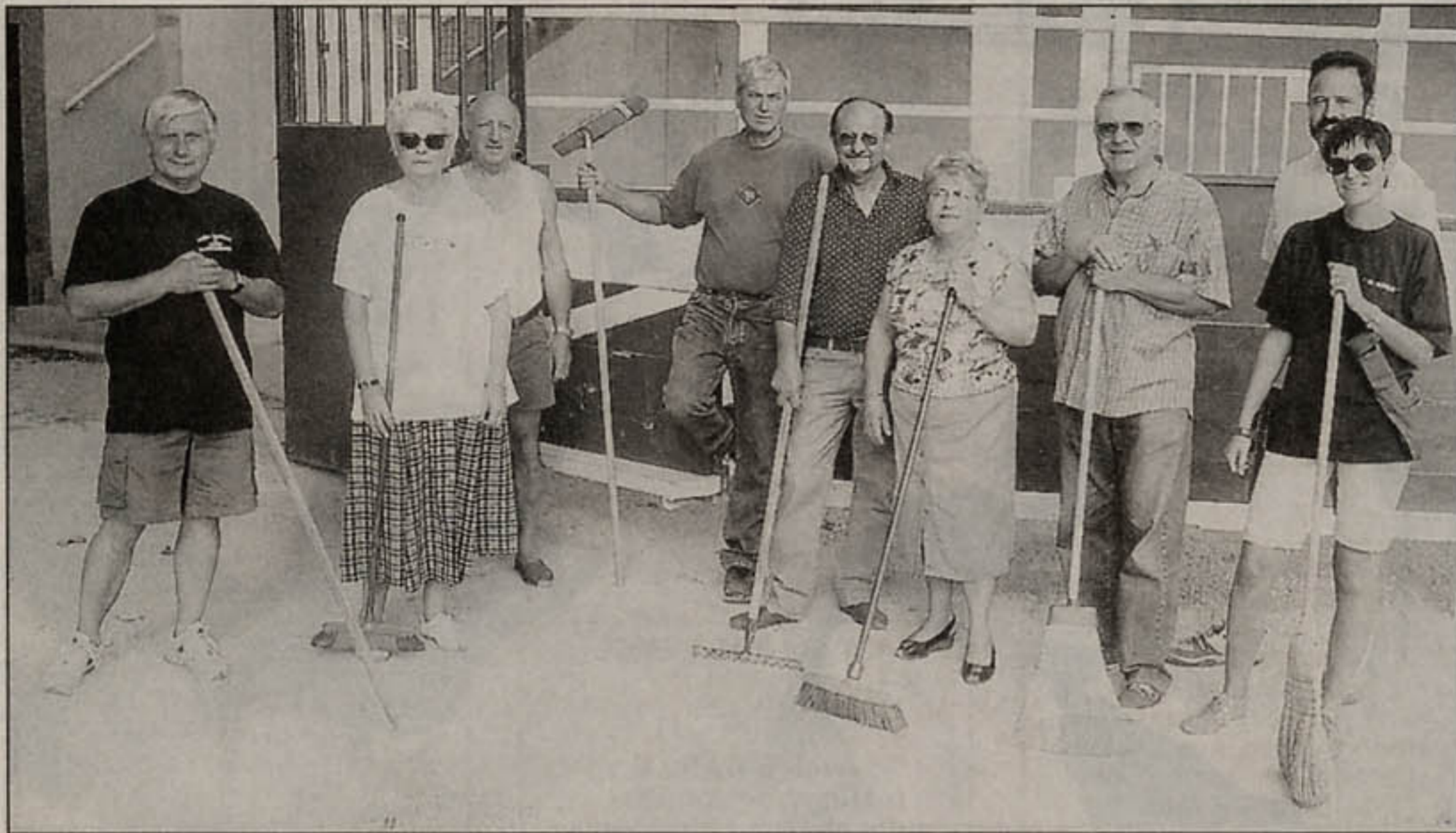
Les bénévoles d'El Toreo sont venus le matin pour mettre la piste en état d'accueillir la capea. Ceux du club taurin d'Eyragues leur ont prêté main forte.