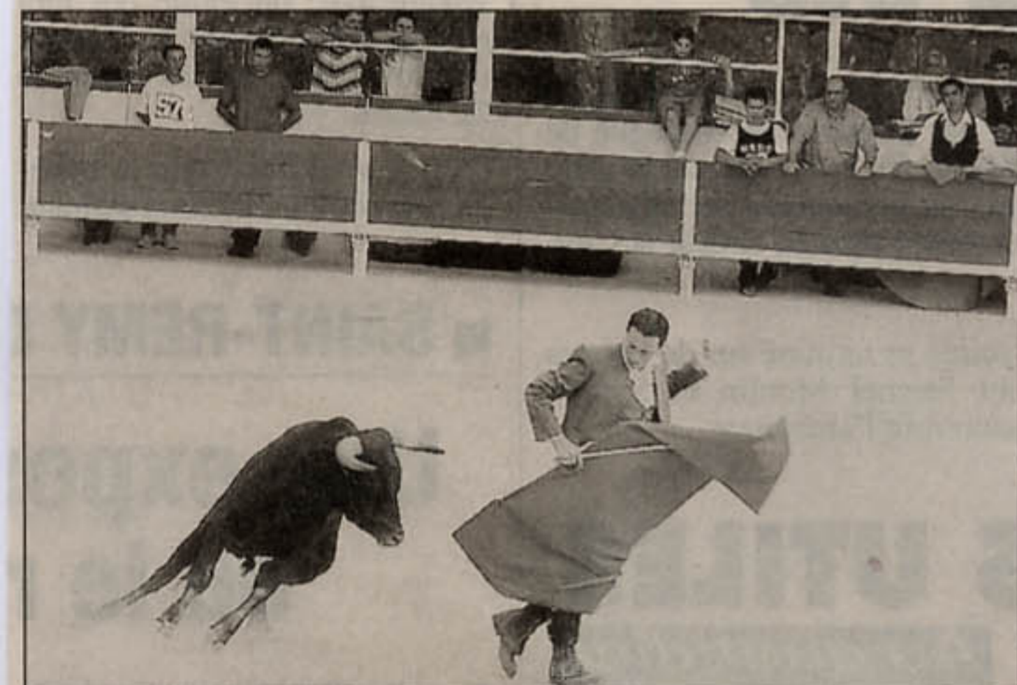
El Chino a fini sa prestation par un superbe simulacre de mort.